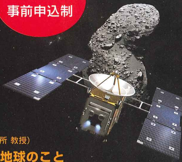
イラスト:池下 章裕