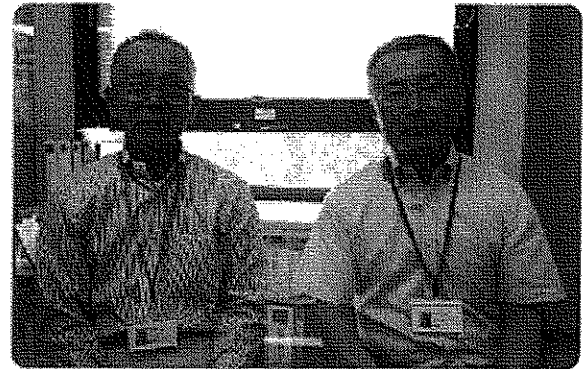
専任アドバイザー

平成18年度からの累計相談件数:1,550件 累計Uターン就職者数:150人 (他に創業された方:10人) (平成25年3月末現在)