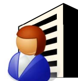
利害関係企業等の方

(許認可でお世話したしな...) 3月に退職するので雇ってくださいね。 【再就職の要求・依頼】