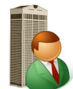
再就職した 国家公務員OB

再就職した国家公務員OBは、離職後2年間、元の職場への働きかけが禁止されています(一部例外あり)。