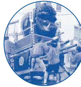
●秋葉町「子供山若浮立」