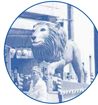
●中央区「ライオンキング」