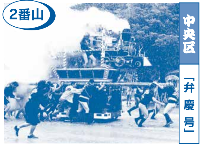
2番山 中央区 「弁慶号」