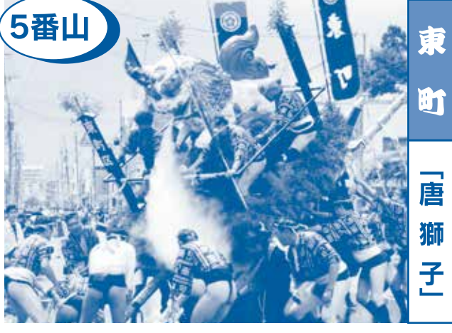
5番山 東町 「唐獅子」