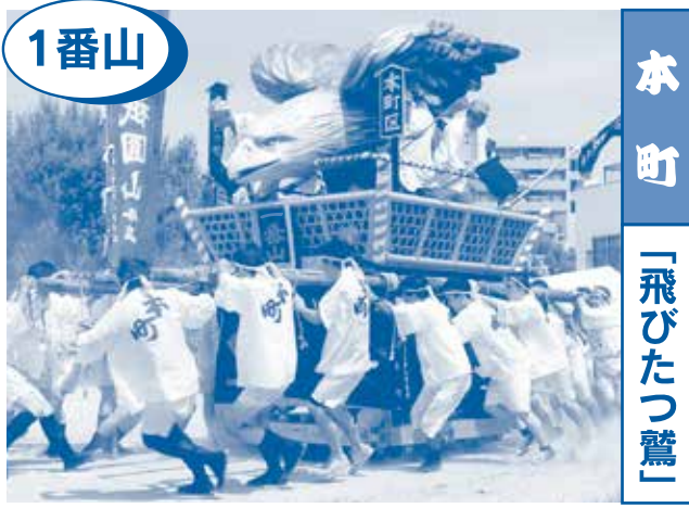
1番山 本町 「飛びたつ鷺」