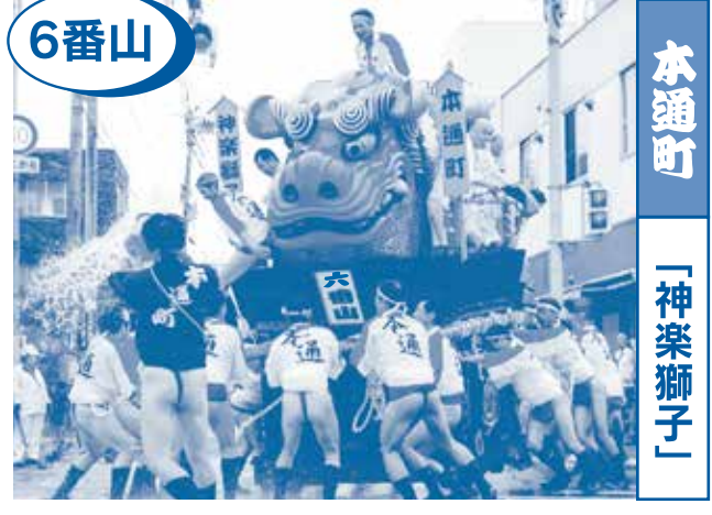
6番山 本通町 「神楽獅子」