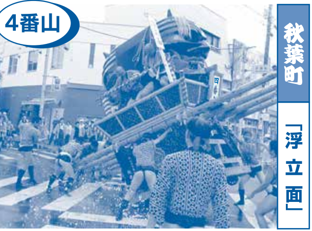
4番山 秋葉町 「浮立面」