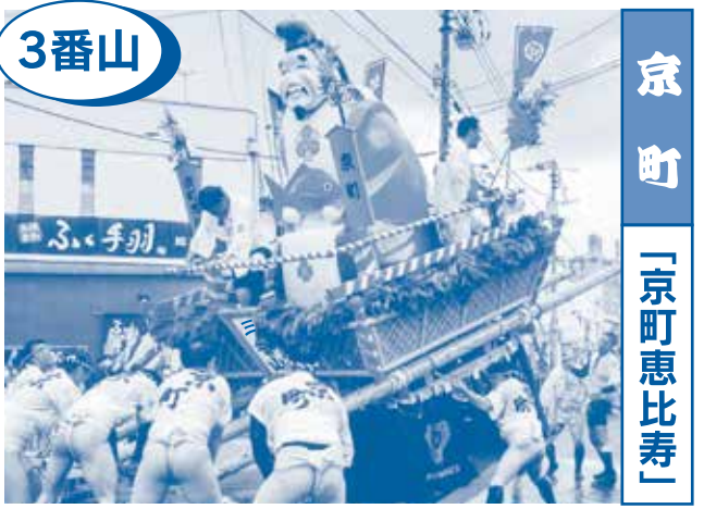
3番山 京町 「京町恵比寿」