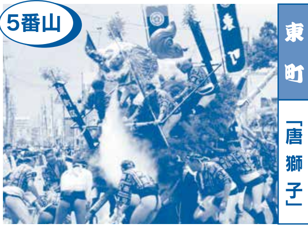
5番山 東町 「唐獅子」