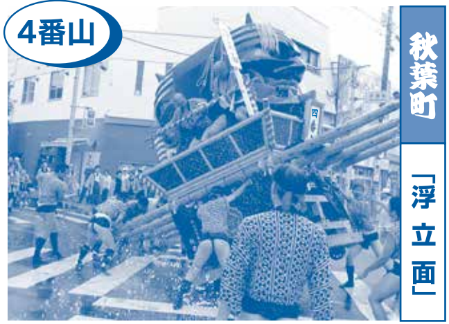
4番山 秋葉町 「浮立面」