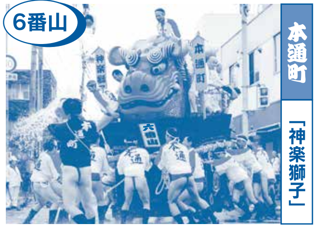
6番山 本通町 「神楽獅子」